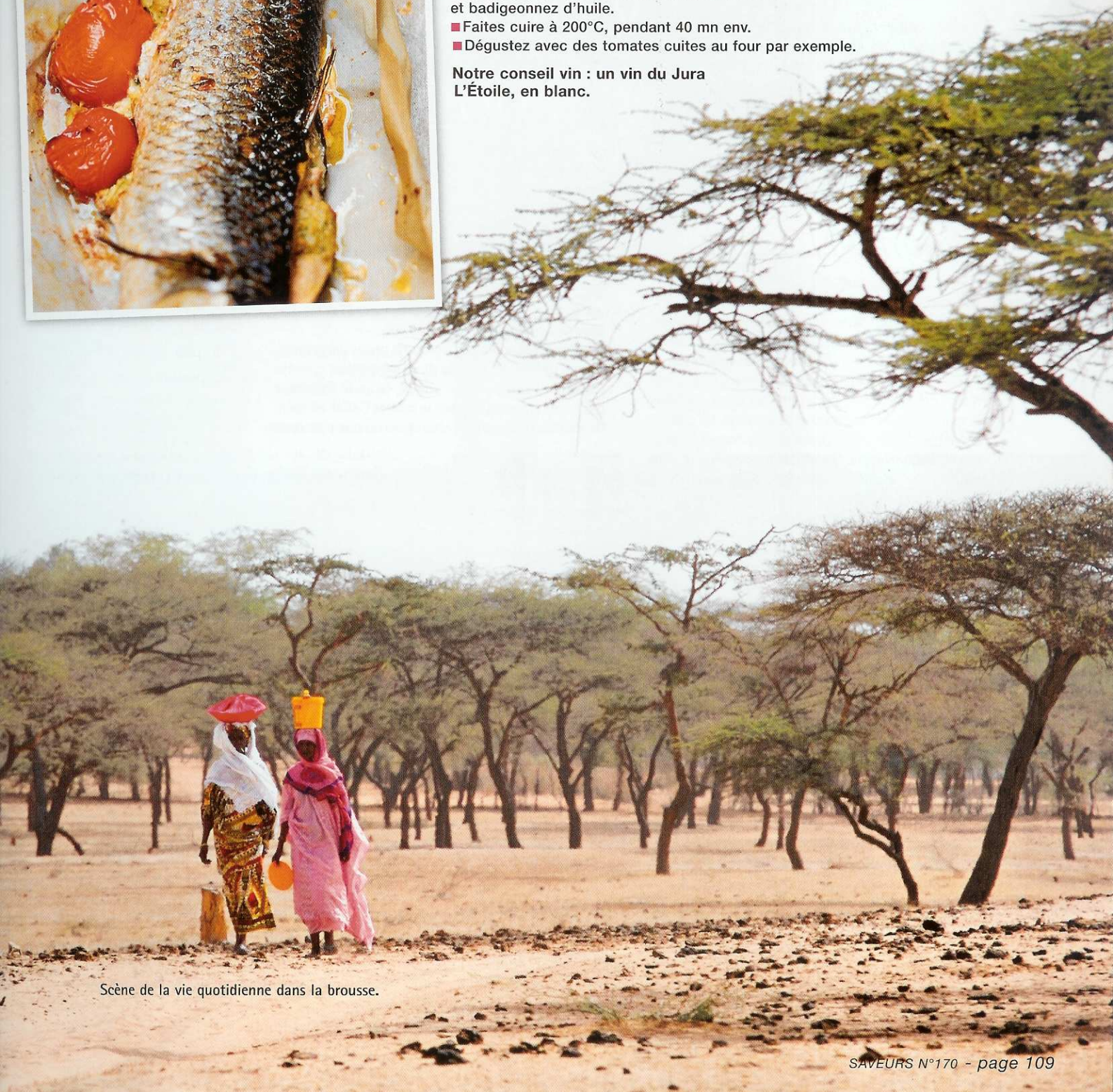
Scène de la vie quotidienne dans la brousse.

Notre conseil vin : un vin du Jura L'Étoile, en blanc.