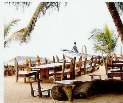
Grillades sur la plage au Tama Lodge.