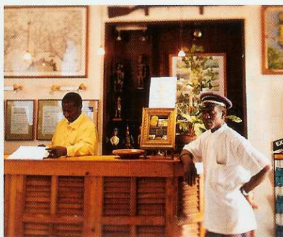
On prend pension à l'hôtel La Résidence.

■ Plusieurs excursions sont possibles à partir des hôtels que nous vous proposons ci-contre.